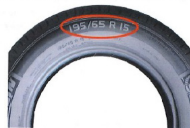
Figura 2: Ejemplos de datos que deben ser visibles en la fotografía del neumático