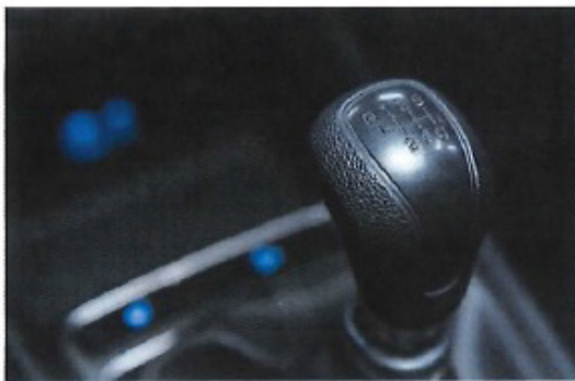
Figura 3: Transmisión manual de 6 marchas