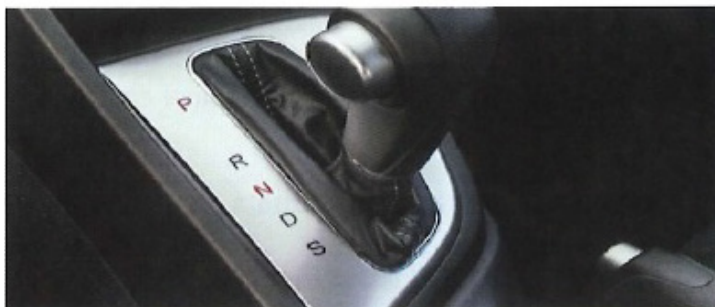
Figura 4: Transmisión automática